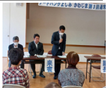
吉見町宮崎町長のごあいさつ