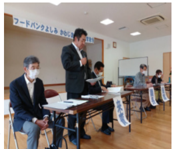
吉見町大澤教育長ごあいさつ