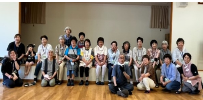
パントリーを支えていただいているボランティアのみなさん