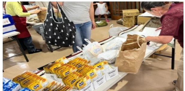
昨年のパントリーでの様子です。